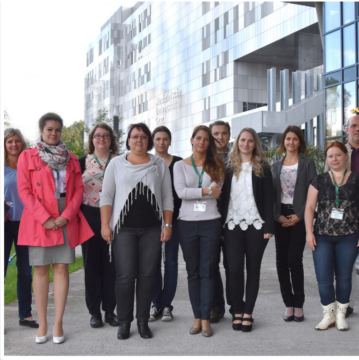
Tuesday, 04. October 2016