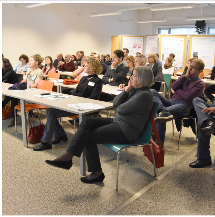
Thursday, 03. November 2016