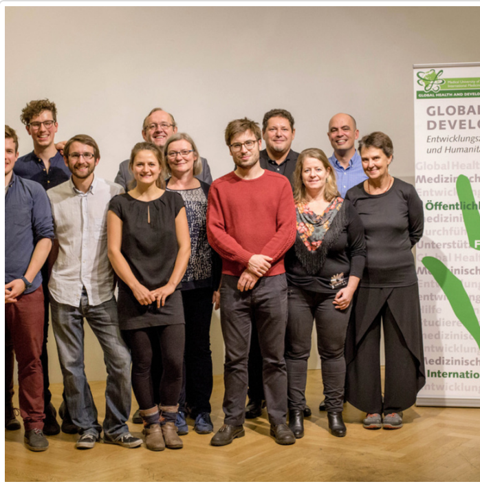
Tuesday, 08. November 2016