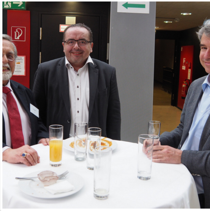
Wednesday, 29. March 2017