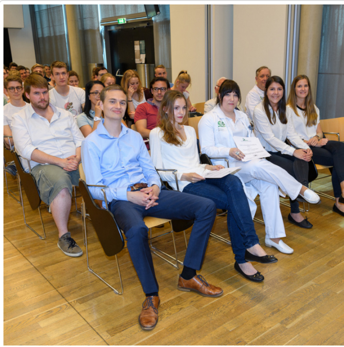
Wednesday, 24. May 2017