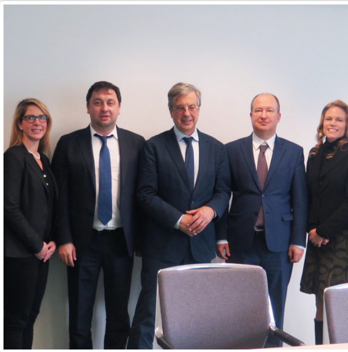
Friday, 07. December 2018