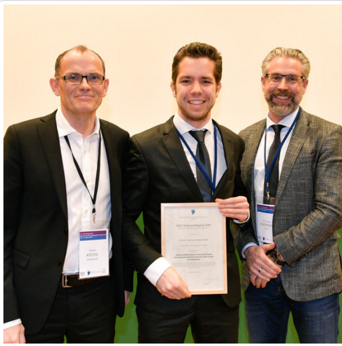
Tuesday, 21. May 2019