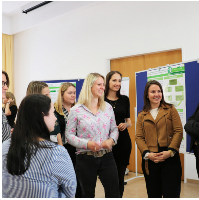
Wednesday, 22. May 2019