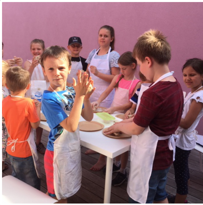
Thursday, 13. June 2019