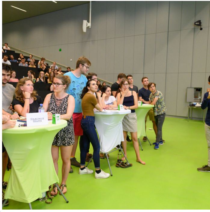
Thursday, 11. July 2019