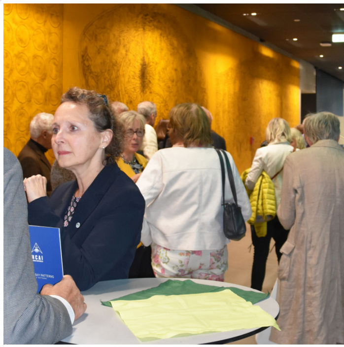
Wednesday, 16. October 2019