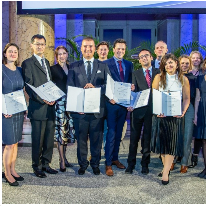
Thursday, 14. November 2019