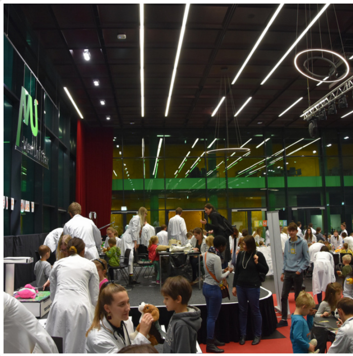
Wednesday, 20. November 2019