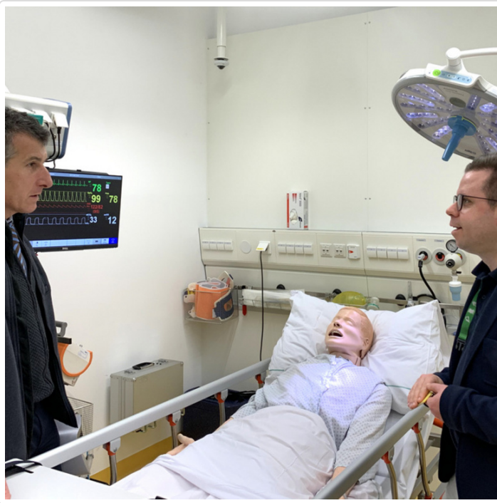
Monday, 24. February 2020