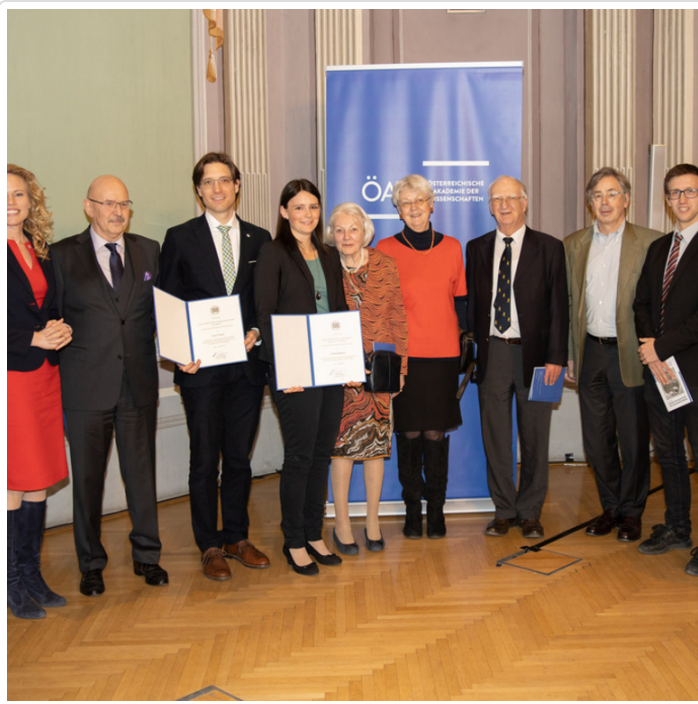
Wednesday, 04. March 2020