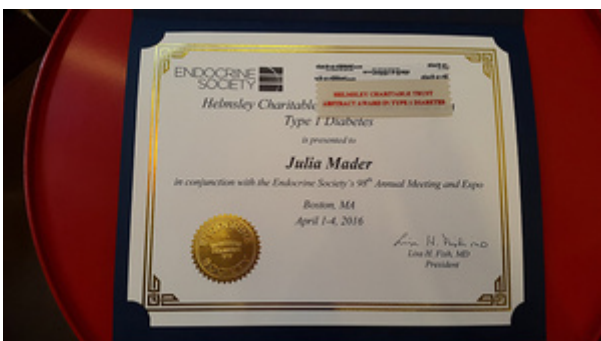
Erfolgreiche Diabetesforschung aus Graz