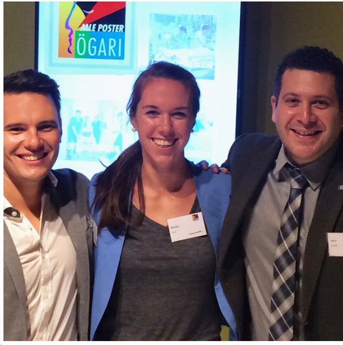
Wednesday, 12. October 2016