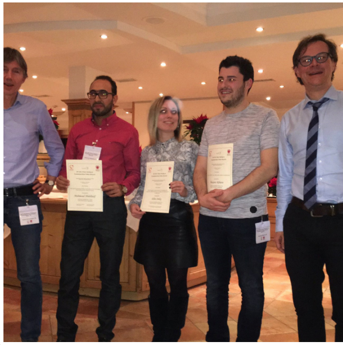
Wednesday, 01. February 2017