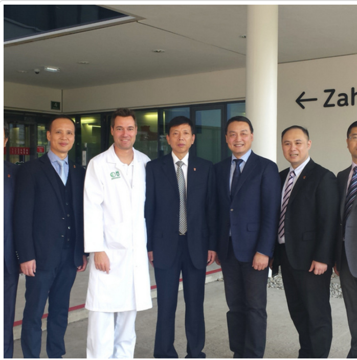
Tuesday, 24. October 2017