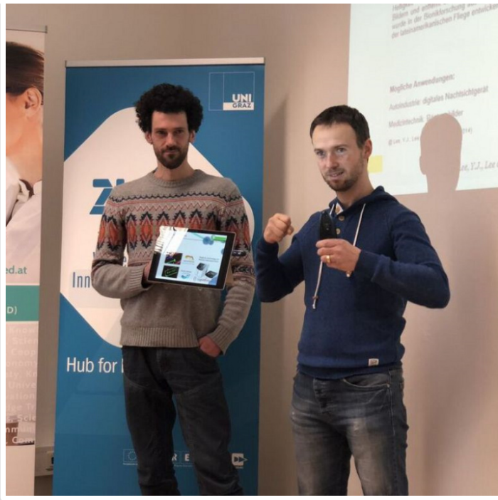
Friday, 09. March 2018