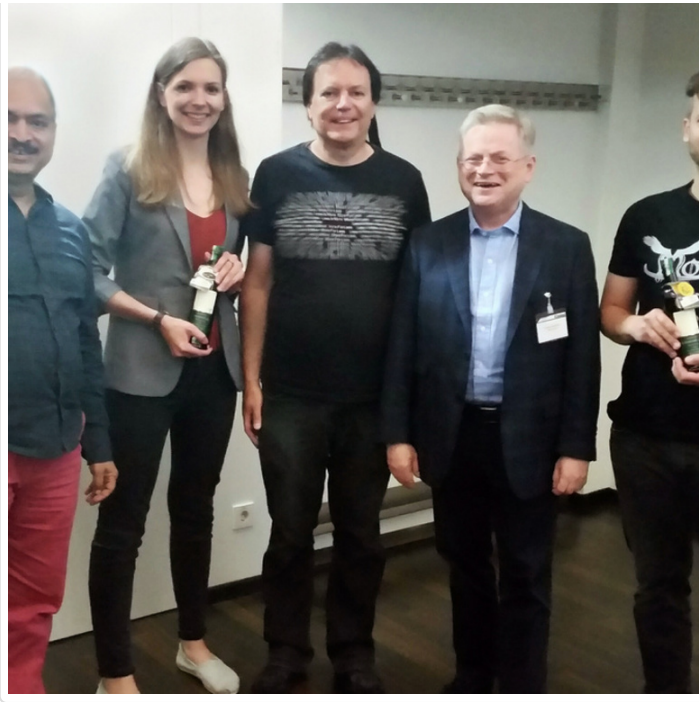
Friday, 22. June 2018