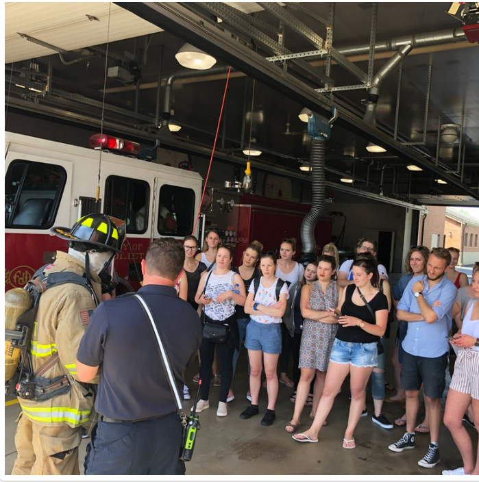
Thursday, 28. June 2018