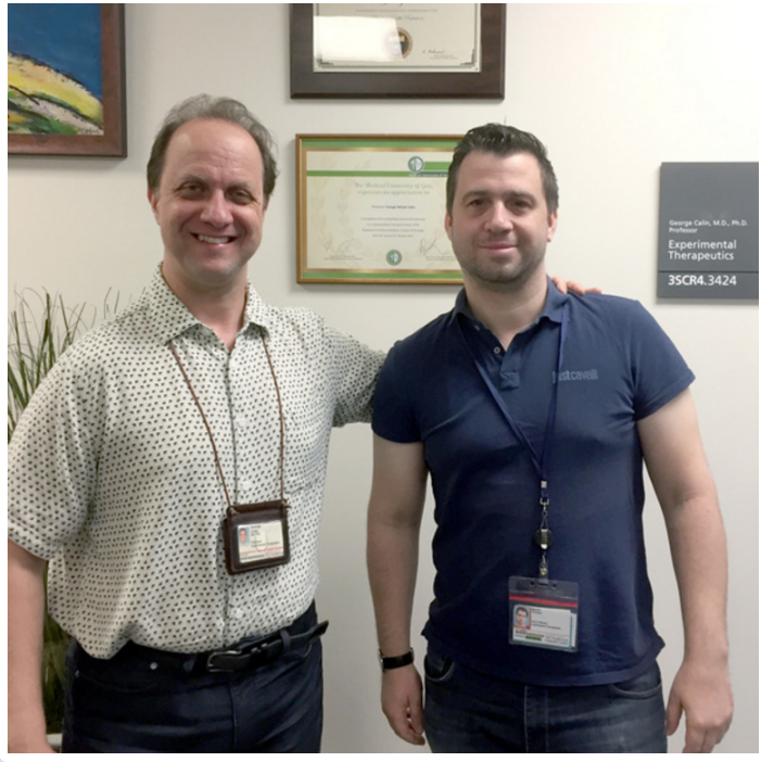
Tuesday, 14. August 2018