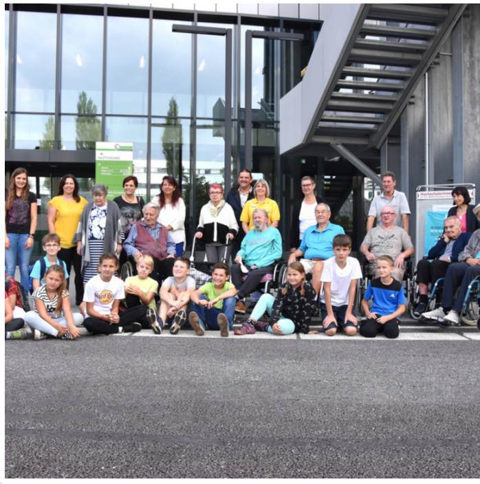
Thursday, 06. September 2018