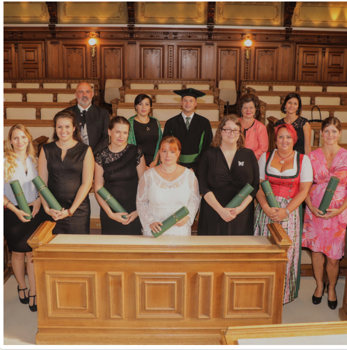
Monday, 17. September 2018