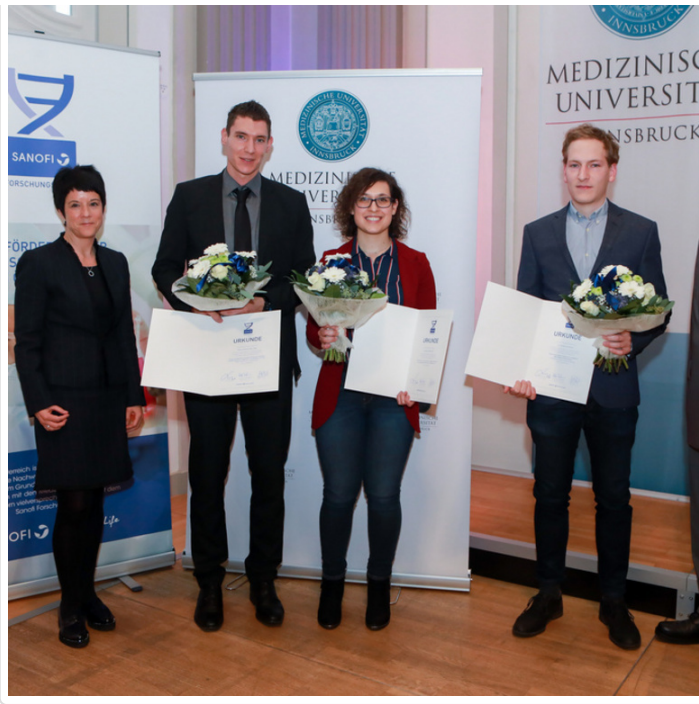
Monday, 19. November 2018