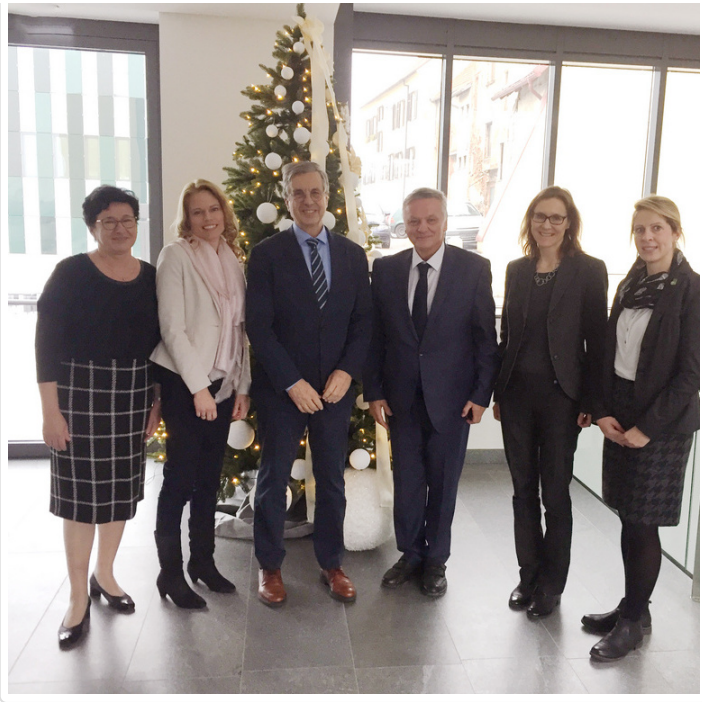
Friday, 14. December 2018