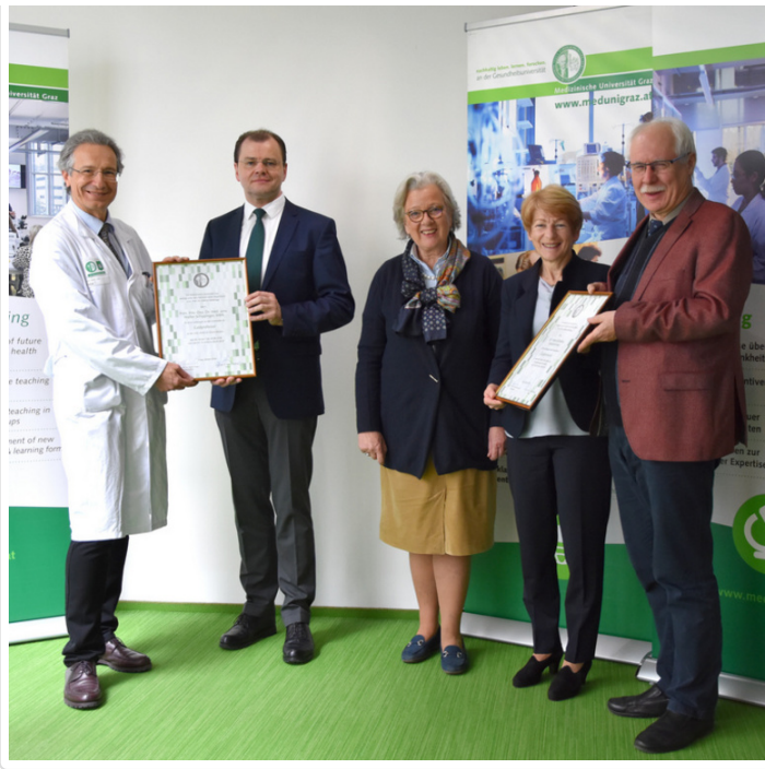
Friday, 01. March 2019