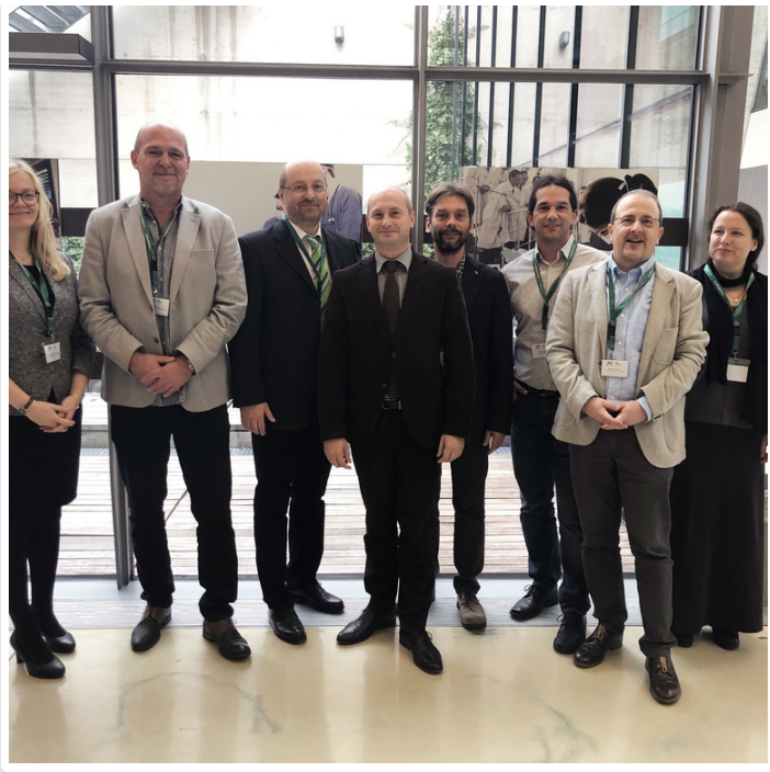
Wednesday, 23. October 2019